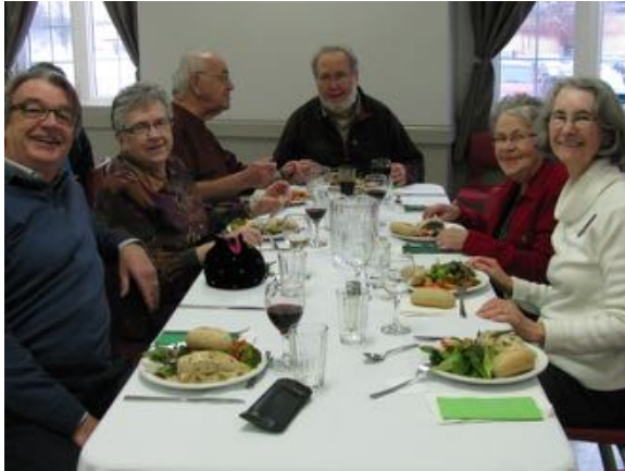
À gauche, table de convives au diner du 2 mars dernier