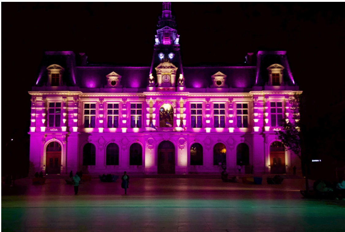
hôtel de ville de Poitiers, France, été 2022