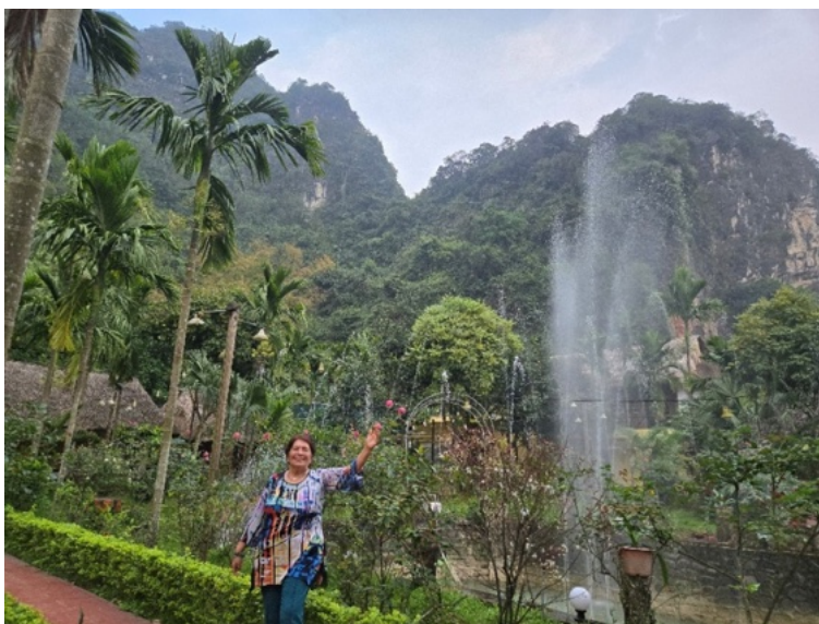
Randonnée à travers la nature, les rizières et villages à Pu Luong.

«Au mois d'avril je suis allée au Vietnam avec un groupe de francophones. Nous avons eu le grand plaisir de parcourir tout le Vietnam du nord au sud. Quelles découvertes, une histoire socio-politique bouleversante, une nature riche et paisible, une nourriture saine et délicieuse, et des personnes accueillantes. Je vous partage quelques photos. »