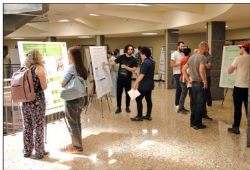
Exposition d'affiches de recherche de premier cycle